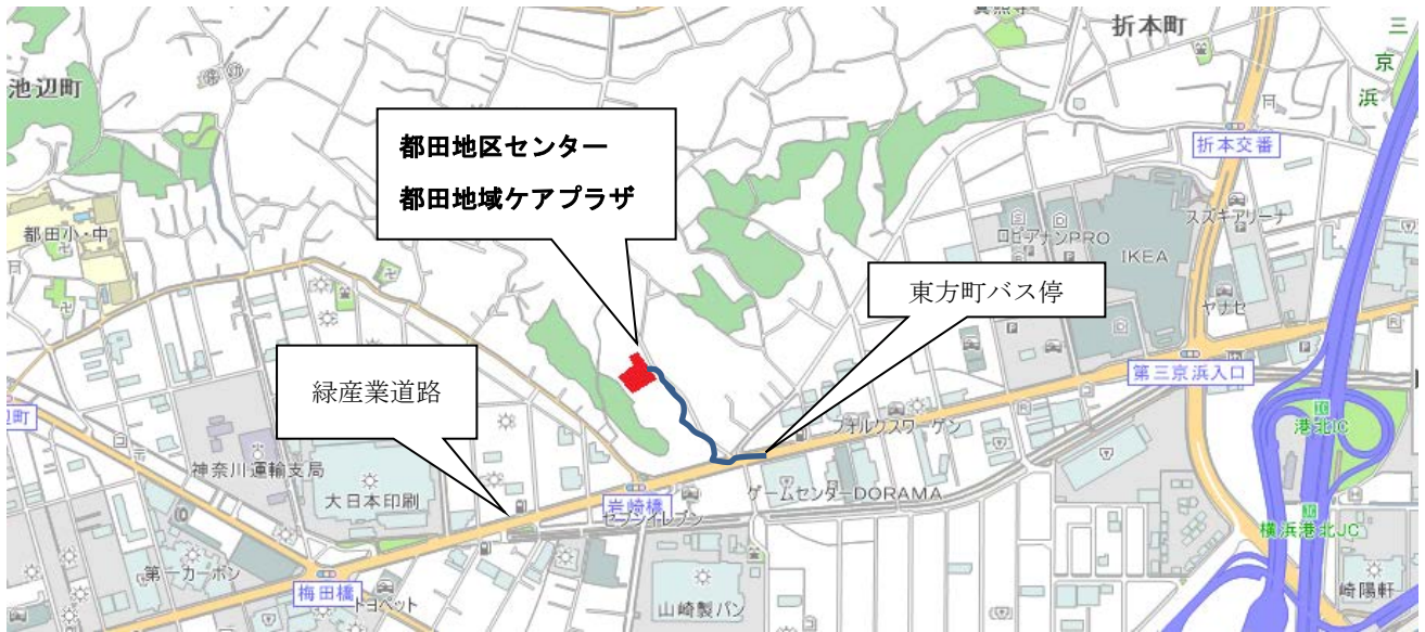
横浜市営バス 41 系統 東方町徒歩 6 分 (約 250m)