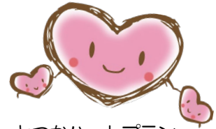
とつかハートプラン マスコット「こころん」