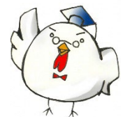
戸塚区健康キャラクター 「けんこっこ先生」