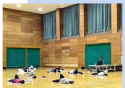
▲エンジョイさわやか体操教室風景

体育室に冷暖房が設置されました！快適に運動ができます。スポーツ種目や、健康体操系など、赤ちゃんから高齢者までさまざまな世代向けの教室も開催しています！