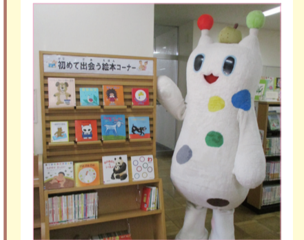
▲赤ちゃんから楽しめる絵本を集めた「初めて出会う絵本コーナー」が人気です! ベビーカーのままどうぞ。