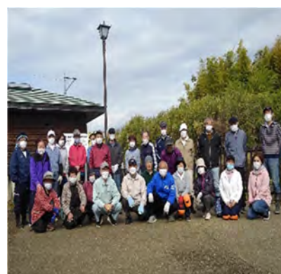
集いのまほろば水辺愛護会のみなさん

しかし、河川環境施設の多くは整備から長期間が経過することで老朽化しており、特に河道内に整備された施設は大雨の影響を受けやすく、阿久和川の「集いのまほろば」に整備された木製デッキは損傷が著しいため令和5年1月から使用禁止としています。