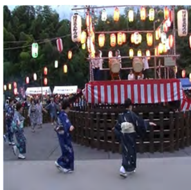
河川環境施設を活用した夏祭り (阿久和川_集いのまほろば)