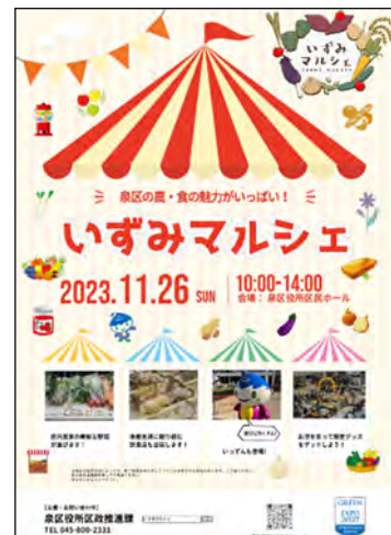
地産地消イベント「いずみマルシェ」