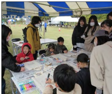
フェリス学院大学と協働したワークショップ