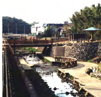
阿久和川_集いのまほろば 完成時（平成10年）

しかし、河川環境施設の多くは整備から長期間が経過することで老朽化しており、特に河道内に整備された施設は大雨の影響を受けやすく、阿久和川の「集いのまほろば」に整備された木製デッキは損傷が著しいため令和5年1月から使用禁止としています。