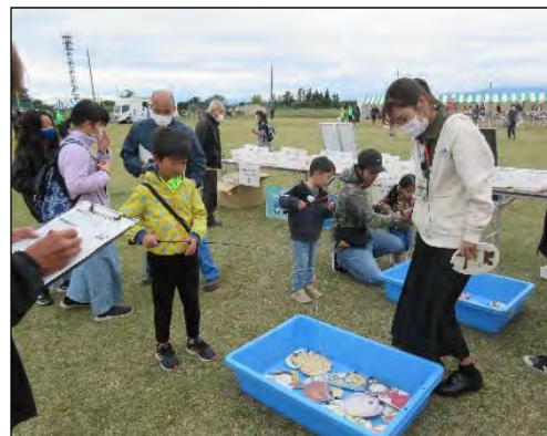
ごみ分別釣りゲーム

令和6年10月から、現在リサイクルしているプラスチック製容器包装に加え、ハンガーやバケツなどのプラスチック製品も分別の対象になります。プラスチック資源の分別拡大は、燃やすごみの量を減らし、温室効果ガスの削減につながります。