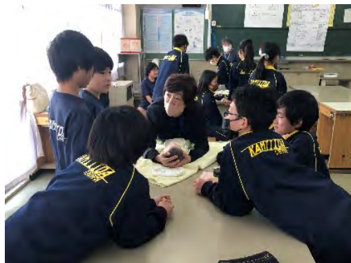
首のすわらない赤ちゃん人形を抱っこします。