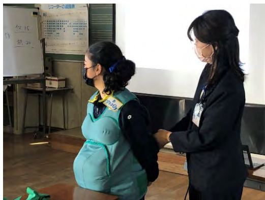
代表生徒による妊婦体験

中学生にとっては、命の誕生の尊さや自分自身が多くの人や地域から見守られて育ててきたことを実感する機会となったようです。