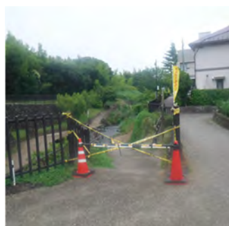
阿久和川_集いのまほろば 現況（令和5年）