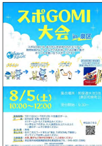
スポ GOMI 大会