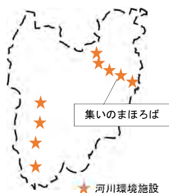
泉区内の河川環境施設

また、河川や水辺で活動している水辺愛護会も18区で最も多く、なかでも阿久和川で活動している「集いのまほろば水辺愛護会」は25年にわたる活動が評価され、令和5年4月に日本河川協会「河川功労者」表彰を受けました。