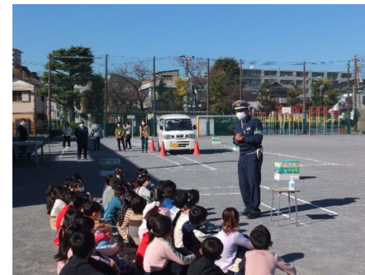
「児童交通安全教室（磯子小）」