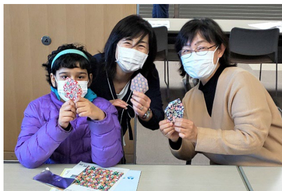
「折り紙体験で国際交流（令和3年度）」