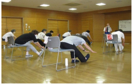
「元気づくりステーション（滝頭）」