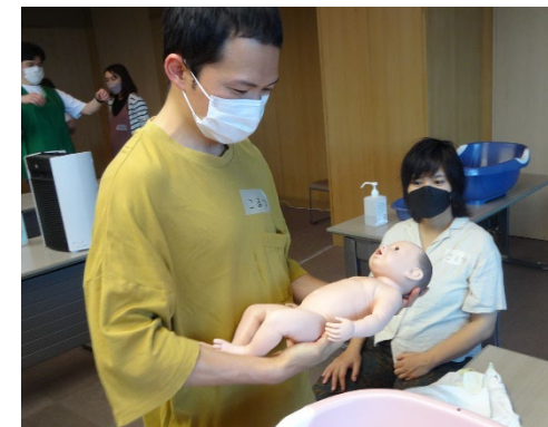
「プレパパ出産・育児教室」