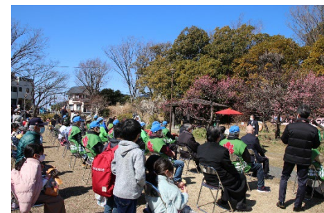
「洋光台地区ミニ健民祭（洋光台）」