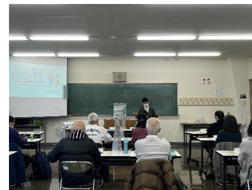
「日本語教室事業（令和3年度）」