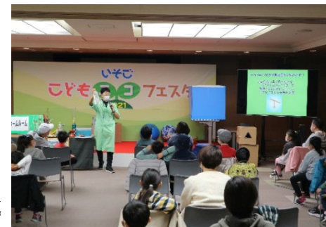
「いそごこどもエコフェスタ」