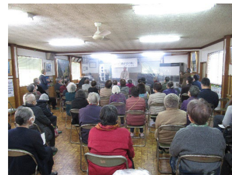
「高齢者の集い（岡村）」