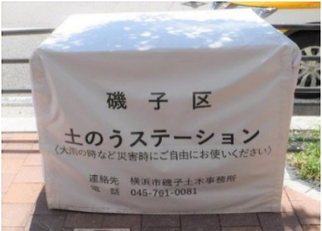
「土のうステーション」