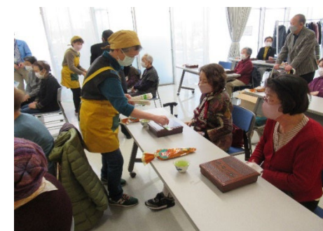
「磯子地区の昼食会」