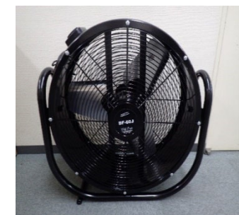
「サーキュレーター」