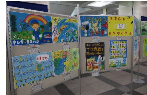
「磯子区環境パネル展」