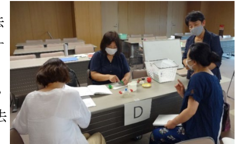
「怒らない子育てサポーター養成講座」

子どもと女性の生活の安全を守るために、弁護士による専門相談を実施します。子どもと女性の生活の安全を守るために、弁護士による専門相談を実施します。