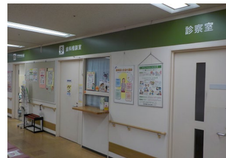
「健診フロアの案内表示」