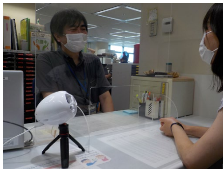
「窓口用マイク・スピーカー」