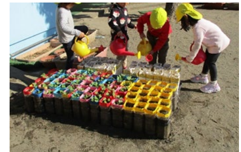
「花いっぱい 野菜いっぱい あったか保育園事業」