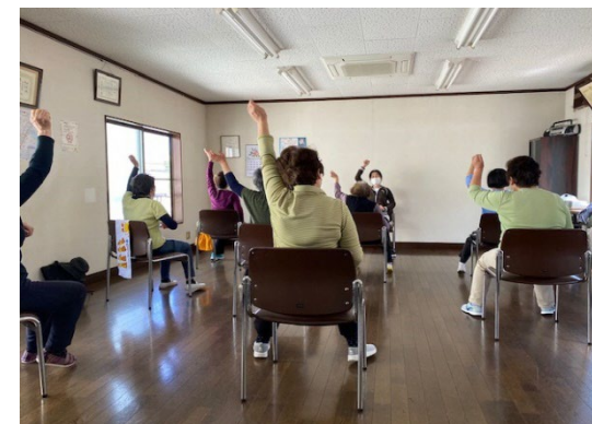
「介護予防グループ活動(根岸)」

※ 加齢に伴い心身の機能等(筋力、認知機能、社会とのつながりなど)が低下した状態を意味する。