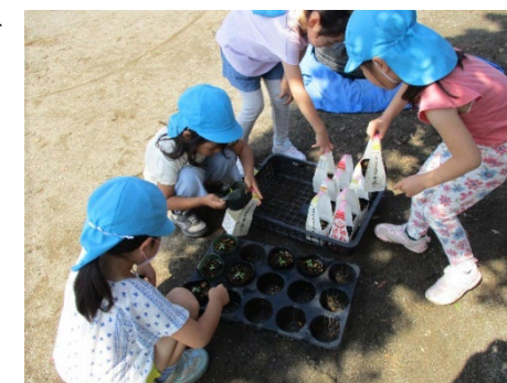
「花いっぱい 野菜いっぱい あったか保育園事業」