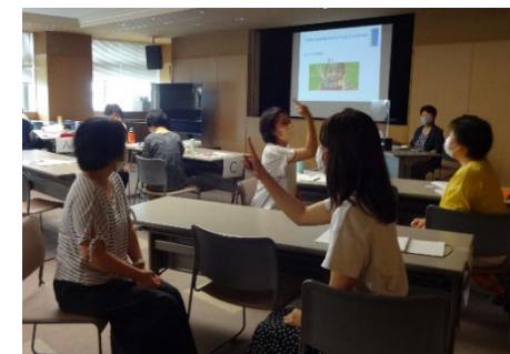
「怒らない子育てサポーター養成講座」