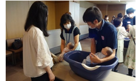
「プレパパ出産・育児教室」