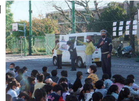
「はまっ子交通安全教室（汐見台小）」