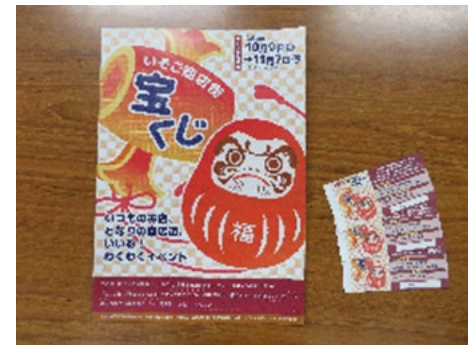
「いそご商店街宝くじ」