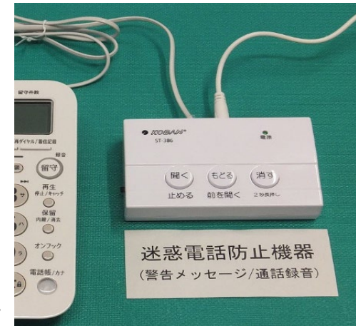
「迷惑電話防止機器」