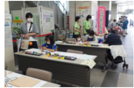
「いそご地域活動フォーラム」