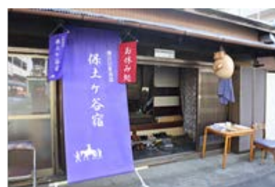
旧東海道保土ヶ谷宿お休み処