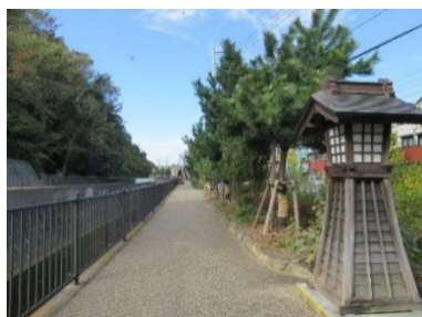
松並木プロムナード