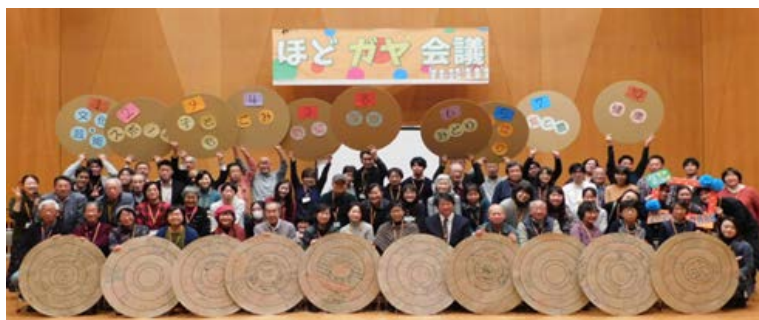
第1回 ほどガヤ会議

「ほどガヤ会議 ※ 」に地域で活動している方々を加え、100周年に向けた取組をテーマとして開催し、そこで生み出されたアイデアの種を、地域の既存団体による新たな取組や新たに形成される活動団体による取組として具体化します。