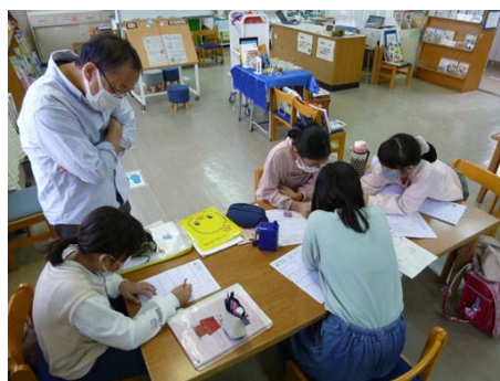
学習支援の様子(星川小学校放課後キッズクラブ)