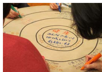
ほどガヤ会議の様子 (テーマごとに円卓を囲み、 課題解決のアイデア出しやデ ィスカッションを実施)