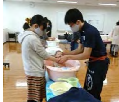
プレパパ・プレママ教室