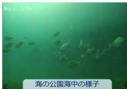
海の公園海中の様子(令和2年10月撮影)