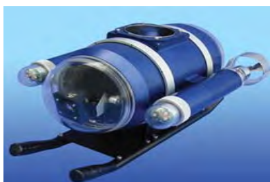
LINKAI横浜金沢内企業が開発した水中カメラロボットを使用