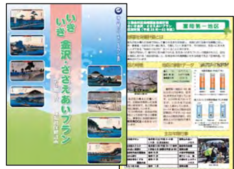
金沢区地域福祉保健計画