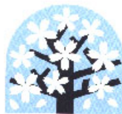
区の木「ヤマザクラ」