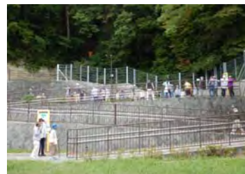
津波避難訓練実施風景