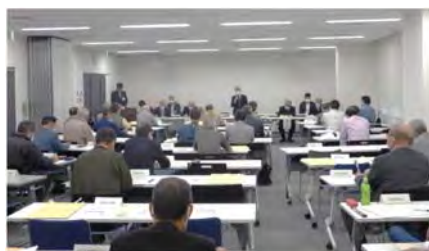
地域防災拠点運営委員会連絡協議会及び訓練実施風景