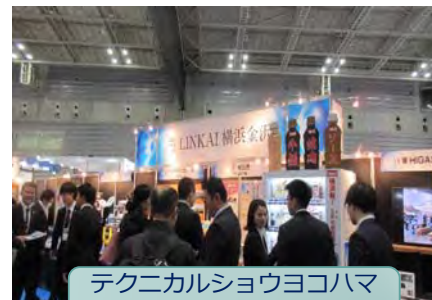
テクニカルショウヨコハマ(令和元年度)