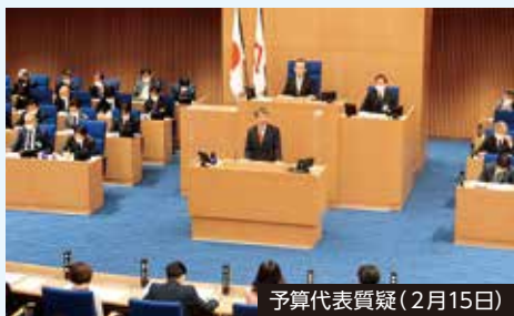
予算代表質疑(2月15日)