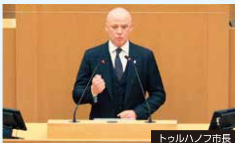
トゥルハノフ市長