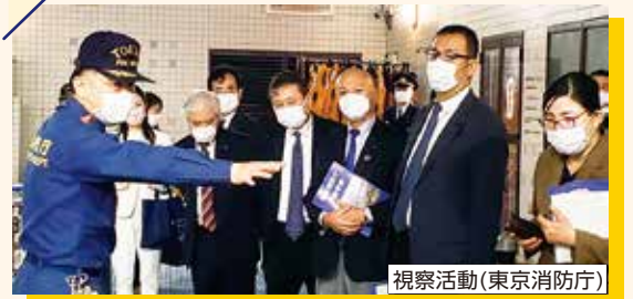
視察活動(東京消防庁)

また、第2回~4回の定例会では、本会議で「一般質問」を行い、市政全般について市長などと議論するなどします。