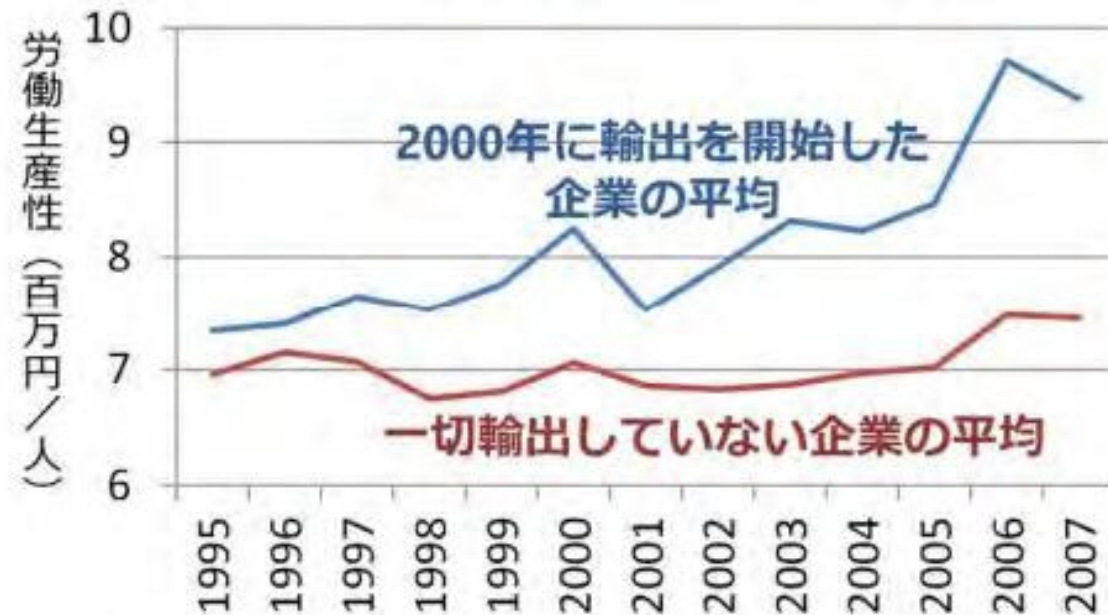
図1：日本における輸出企業と被輸出企業の労働生産性

RIETI Research Institute of Economy, Trade & Industry, IAA 独立行政法人経済産業研究所 http://www.rieti.go.jp/