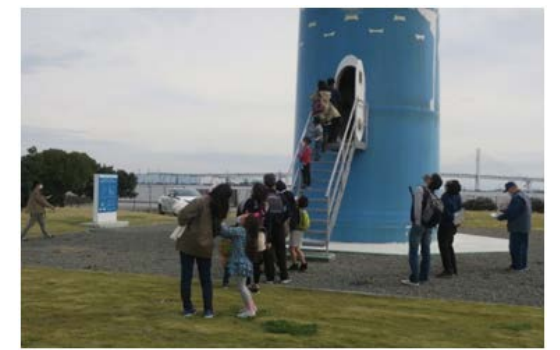
秋の風車見学会(令和3年11月7日)