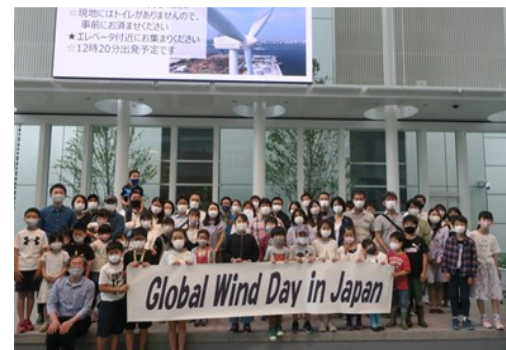
世界的な風車イベント「グローバルウィンドデー(6月15日)」 にあわせた、親子風車見学会(令和3年6月6日)