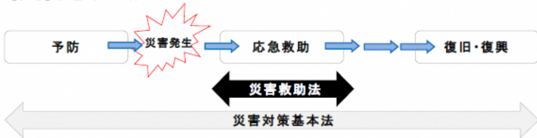
【参考】災害対応法制のイメージ図