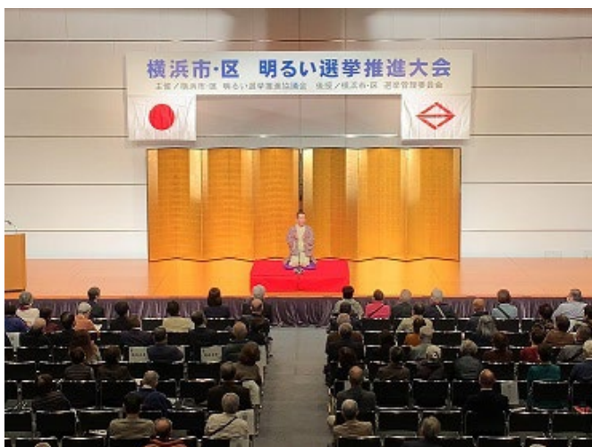
▽落語家による講演