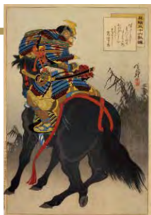
「英雄三十六歌撰 畠山重忠」

畠山重忠が敗れた二俣川の戦いでは、北条氏数万の軍勢に対し、重忠側は僅か135騎だったと言われています。北条氏に謀反の疑いをかけられた重忠でしたが、幕府に対して異心はなく、「進んで討たれても武士の名誉を重んずる」と、国に帰って陣を立て直すことなくこの地で最期を遂げました。重忠は、NHK大河ドラマ「鎌倉殿の13人」にも登場します。