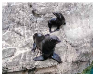
▲オスとメスの体格差は、 体長で約2倍、体重で約4倍