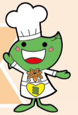
緑区キャラクター「ミドリ」