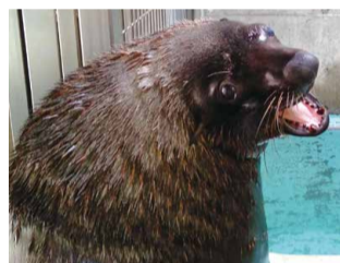
▲オスにはライオンの様な たてがみがある

ミナミアフリカオットセイはオットセイ類では最大で、アフリカ大陸の南アフリカからナミビアにかけての沿岸に生息します。オスは体長2～2.3m、体重250～350kg、メスは体長1.2～1.6mになります。繁殖期には沿岸の岩場を埋め尽くすほどのオットセイが集結し、オス同士が飲まず食わずで戦います。勝ち抜いたオスがメスと交尾をすることができるので、体が大きくなったと考えられています。日本ではあまりなじみがない動物ですが、冬に千葉県 の 沖合でキタオットセイを観察することができます。