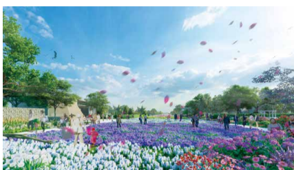
※イメージ図

GREEN×EXPO 2027は、国際的な園芸文化の普及や花と緑のあふれる暮らし、地域・経済の創造や社会的な課題解決への貢献を目的に開催します。今年度は、あらゆる機会をとらえて広報PRを積極的に展開します。