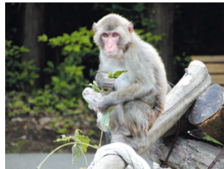
▲食べている姿もかわいいです!