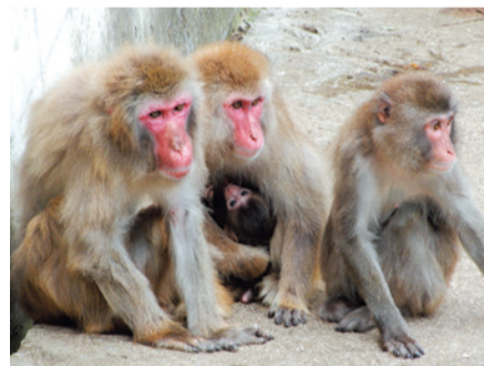
▲授乳中の赤ちゃんをみんなで守っています

現在ズーラシアでは22頭(オス7頭、メス15頭)飼育しており、今年の5月末に2頭の赤ちゃんが誕生しました。出産した母親だけではなく、その娘やその他のサルたちも育児に協力的な姿が見られます。またニホンザルはとても表情豊かな動物なので、毛繕い中の気持ち良さそうな顔や餌の取り合い中の怒った顔、子ども同士が遊んで楽しそうな顔など、さまざまな表情が観察できます。かわいい赤ちゃんも加わったにぎやかなニホンザルたちに会いに来てください!