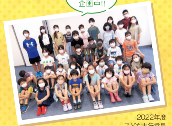
2022年度 子ども実行委員

公募で集まった子ども実行委員が、どのようなまちにしたいかを考え、まちに必要な仕事やお店などを準備しています!