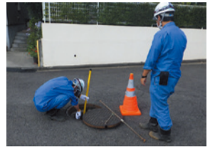
▲下水道管調査の様子

緑区の下水道管の長さは、横浜から北海道旭川市までの距離と同じ、約980kmもあります。