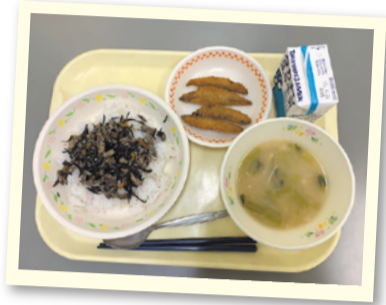
▲長津田産の小松菜を使った味噌汁が出た日の給食

その他にも、田奈農協野菜研究部会・学校給食会は、児童たちを対象とした野菜の育て方などの特別授業を行うこともあり、農業を通じて小学生の食育に貢献しています。