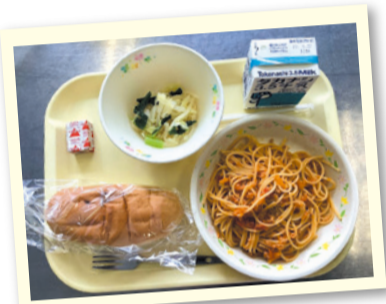
▲長津田産の大根、小松菜、キャベツに玉ねぎのドレッシングがかかった「長津田そだちサラダ」