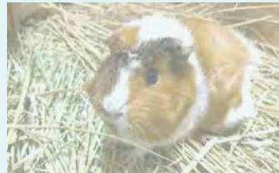
▲巻き毛のモルモット

よこはま動物園ズーラシアでは、このモルモットとパンダマウスと触れ合うことができます(整理券制)。子年の今年、是非遊びにきてください。