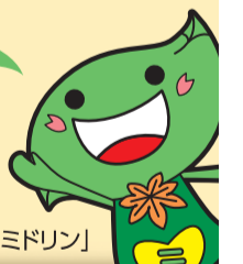
緑区キャラクター「ミドリん」