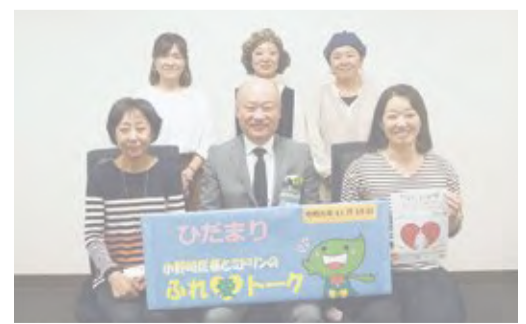
▲ひだまりの皆さんと

地域の中には、ハンドメイド作品制作以外にも、さまざまな特技を持つ人たちがつながりあって活動する団体が多くあります。このような活動を支援し、地域が持つ力をさらに高めていくことも行政の役割だと思っています。緑区の中で、人々の交流が活発になり、地元をもっと好きになる人が増えてくるように、引き続き取り組んでまいります。