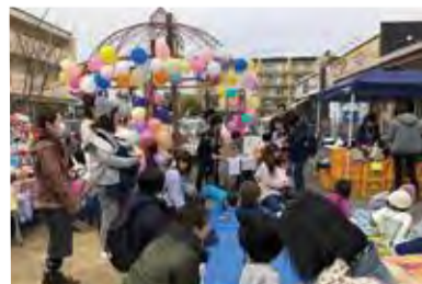
▲みなみ台多世代交流バザール

他のメンバーからは「現在の活動として、年4回程度『みなみ台多世代交流バザール』を開催しています。バザールには、子育て世代を中心に、幅広い世代の皆さんが参加しています。特に、バザールの中でも人気が高いものに、ハンドメイド作品の販売があります。作品はどれも温かみと作製者の強い思いが感じられます。お客様に作品を説明する時には、思いが強い分、ついつい長話をしがちです。しかし、そこから、