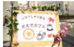
▲かえでカフェの看板