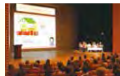
▲介護専門職が地域の資源を劇仕立てで紹介