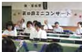
▲昨年の発表会も盛況でした