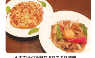
▲市内産の新鮮なタマネギを調理

☎6月8日(水)9時50分受付～14時 ※小雨決行 緑区役所(集合)～タマネギ畑で収穫体験(保土ヶ谷区)～地場野菜の料理教室(中山地区センター)、解散 ※天候や収穫状況等によって内容の変更あり 持ち帰りのタマネギ実費(1個20円、1人5個まで) 1 緑区内在住、在勤、在学者、先着20人 甲 5月11日から電話またはEメールで☎企画調整係(☎930-2228 ☎930-2209) ☑ md-kikaku@city.yokohama.jp