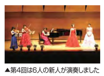
▲第4回は6人の新人が演奏しました

【問合せ】☎生涯学習支援係(☎930-2235 ☎930-2242) ■第128回緑区民音楽祭ふれあいコンサート ～未来に輝け～第5回新人演奏会 オーディションで選ばれたバイオリン、声楽、ピアノ部門の新人演奏家によるコンサートです。 日時:6月26日(日)14時開演(13時30分開場) 会場:みどりアートパーク 対象:先着300人 ※未就学児入場不可 チケット:500円(全席自由席)5月11日からみどりアートパーク、山響楽器店中山店、三笠勉強堂で発売 ※前売り券が完売した場合、当日券の販売なし ■第47回 緑区三曲協会定期演奏会 争、三絃、尺八による演奏会です。 日時:5月15日(日)11時開演(10時30分開場) 会場:みどりアートパーク 対象:先着300人 ☑ 問合せ:緑区三曲協会事務局 保坂(☎080-3405-6725) ■第35回みんれん全国大会 民謡・歌謡のコンクールです。津軽三味線や舞踊も披露されます。 日時:6月5日(日)10時開演 会場:緑公会堂 対象:先着500人 ☑ 問合せ:全日本民謡民舞歌謡連盟 吉浜(☎935-1300)