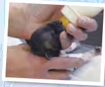
▲生後2日のリカオンの赤ちゃん