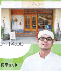
レシピ作成者: 比企野 将平さん▶

◆営業時間:月~金曜日 11:00~18:00 月1回(第2または第4土曜日) 11:00~14:00 ※第1、3、5土曜、日曜、祝日定休