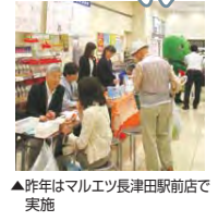
▲昨年はマルエツ長津田駅前店で実施

6月4日～10日は、歯と口の健康週間です。緑区歯科医師会による口腔ケアグッズの配布、無料歯科相談を行います。 日時:6月2日(木)10時～12時受付 会場:ダイエー十日市場店(十日市場町818-2) 定員:先着100人 ☑ 【問合せ】☎健康づくり係(☎930-2359 ☎930-2355)