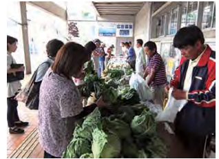
▲野菜の販売でにぎわうビロティ。6・7・10・11・12月第2水曜開催

5月15日(日) 12時～17時、6月8日(水) 8時45分～13時 ※売切れ次第終了、荒天時は実施しない場合があります 会場: 緑区役所本庁舎ビロティ 会場: 企画調整係(電話: 930-2228 ファクス: 930-2209)