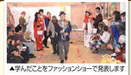
▲学んだことをファッションショーで発表します

着こなし、歩き方、スキンケア、ヘアケア等、おしゃれを学んでみませんか。昨年の参加者からは今までと違う自分を発見でき、若返ったと好評! 今年もプチファッションショーを行う予定です。