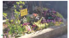
▲東本郷地域ケアプラザの緑化(東本郷地区)