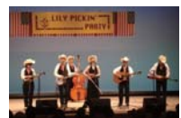
▲そろいのカウボーイハットで 演奏するバンド