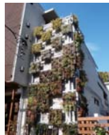
▲壁面を緑化している建物

【問合せ】環境創造局 みどりアップ推進課 (〒231-0017 中区港町1-1 ☎671-2712 ☎224-6627)