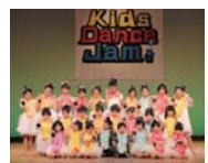
▲華やかな衣装で元気に 踊ります