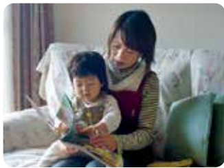
協力:横浜子育てサポートシステム、提供会員