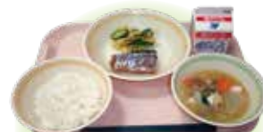
(Menú de muestra) Arroz, caldo de cerdo, pescado hervido, encurtidos instantáneos, leche

En la escuela se toman varias medidas para que los niños puedan comer y disfrutar de las comidas escolares. Las diferencias entre la cantidad de tiempo requerido y la cantidad que se puede comer son comunes al inicio del primer grado, por lo que se consideran el volumen y la cantidad de tiempo para servir, comer y limpiar después de las comidas, en comparación con los otros grados hasta que se acostumbren. Explique sus preocupaciones sobre las alergias a los alimentos (dietas de eliminación, etc.) antes de que el niño/la niña ingrese a la escuela durante los chequeos de salud o reuniones informativas de ingreso a la escuela, etc. Le recomendamos que incentive a su hijo/hija durante las comidas en casa para que se acostumbre a todo tipo de alimentos y aprendan a disfrutarlos.