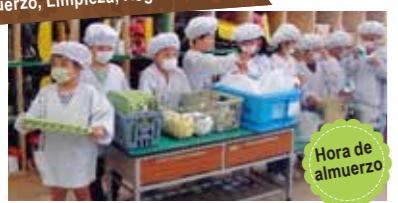
Hora de almuerzo