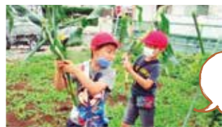
Fui a cosechar el maíz que cultivamos.