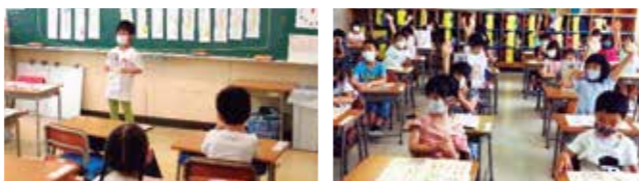
El maestro nos enseña atentamente a leer, escribir y calcular.

* Tiempo de Amistad, Tiempo de Emoción Tiempo de Progreso Constante pueden tener diferentes nombres según la escuela.