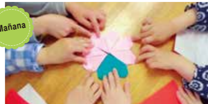
Mañana Jugué a las charadas y Shiritori, moviéndome mucho en el gimnasio.