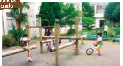
Permite que niños de diferentes grados se junten. (Escena del Club de Niños después de la Escuela)