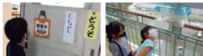
Las escuelas tienen diferentes aulas y profesores. Encontré muchos animalitos. Explorar la escuela es muy emocionante.