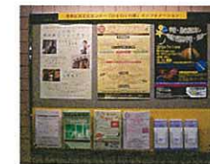
バスターミナル内専用アドボード