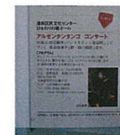
京急グループ広報紙なぎさ