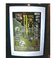
施設内照式ポスターケース