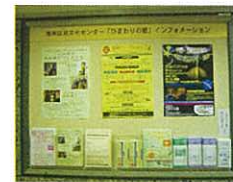
京急上大岡駅構内専用アドボード