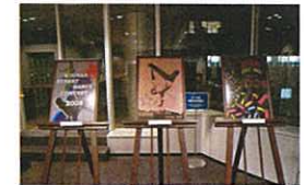
KSDC 高校生ポスターコンテスト