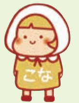
横浜市地域福祉保健計画 推進キャラクター ちふくちゃん(の港南区版 「こなちゃん」)

港南ひまわりプランは、 区役所・区社会福祉協議会・ 区内地域ケアプラザで 配布しています。