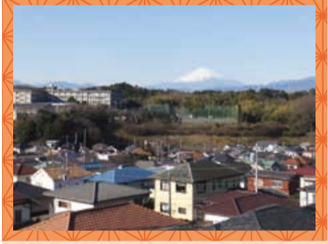
昨年区内で撮影された富士山の写真 （「ひまわり写真館」への応募作品）