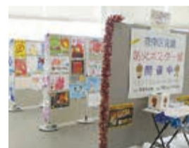
昨年度のポスター展の様子

港南区在住・在学の小学生を対象に募集した作品を展示します。京急百貨店10階(京急・地下鉄上大岡駅下車)でも11月25日(月)～29日(金)に同様の内容で展示を行います。