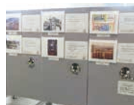
昨年度のパネル展の様子

港南区の今と昔の比較写真や関連図書、図書館の紹介パネルを展示します。港南図書館でも11月30日(土)～12月9日(月)に同様のテーマで展示を行います。