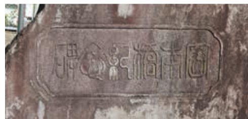
題字は幕末明治期の高僧、円覚寺管長の今北洪川の筆になるもので、周囲を笹下で囲んでいるのは「笹下」にちなんだともいわれています