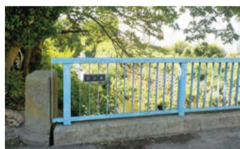
関の下交差点から杉田方面に150mほど行った信号を右折すると、岡本橋が架かっています