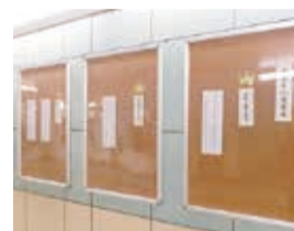
昨年度の俳句展の様子 (上大岡駅コンコースで開催)