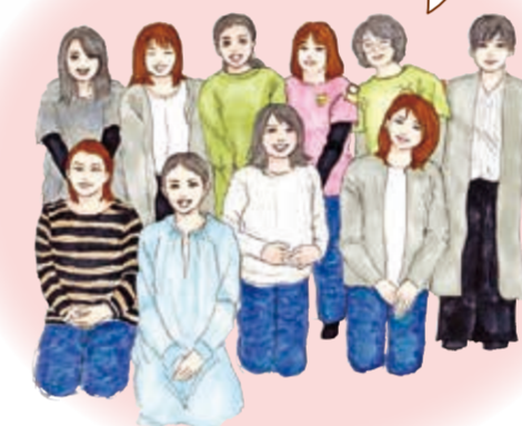
リポーターの皆さん

ママリポーター、地域子育て支援拠点「はっち」のメンバー、区役所職員、みんなの力を合わせて作りました