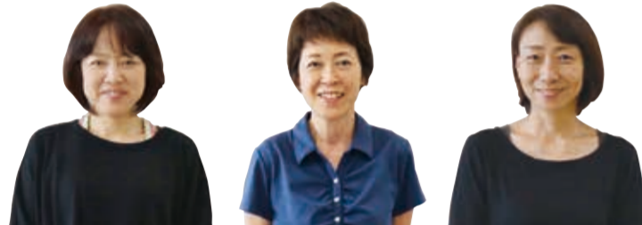
育児支援担当保育士の皆さん (左から) 港南台第二保育園、大久保保育園、野庭第二保育園