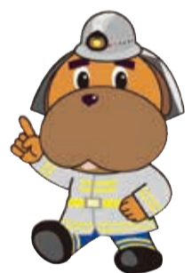
横浜消防 マスコットキャラクター ハマくん