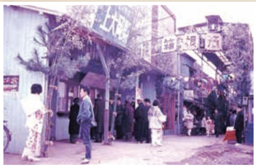
駅ビルへの建替えのために仮駅舎を使っていた昭和37年の正月風景。商店街(現パサージュ上大岡)の名前は、大久保にあった花街の通称名「浜の箱根」にちなんで「箱根通」と名付けられました