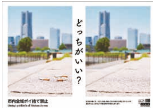
ポイ捨て禁止の啓発ポスター