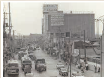
昭和45年の駅前通り(桜岡小学校蔵)

30年代半ばから上大岡は商業地域として発展し、38年には駅ビルが完成。次々と大型店舗ができ、47年12月には、市営地下鉄も開業します。その後、狭い商店街や雑然とした街並みを改良するため、平成4年に再開発事業が開始され、9年に京急百貨店、バスターミナル、オフィスタワーなどの複合施設が完成しました。今や横浜南部地域の拠点にまで成長した上大岡に「信じられないような変貌ぶりだね」と、二人は口をそろえます。