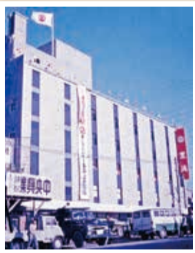
昭和38年に完成した駅ビル。1階に改札口、上階には上大岡初の大型商業施設として京浜百貨店が開業

渡辺さんが越してきたのは昭和30年、歯科大学の学生でした。中区で営んでいた歯科医院が空襲で焼失し、父の代にこの地で開業した時、港南区域の歯科医院は4軒だけでした。東京の大学には京浜急行で通っていましたが、駅周辺は田畑が広がり、ホームからは美しい富士山が見えました。