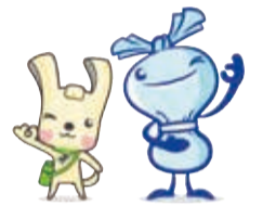
スリム「ヨコハマ3R夢」へら星人 ミーオ マスコット イーオ

問合せ 区役所資源化推進担当 (☎847-8398 ☎842-8193) 資源循環局港南事務所 (☎832-0135 ☎832-5204)