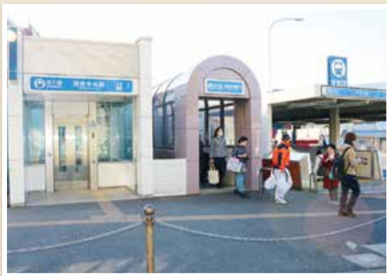
現在の港南中央駅。平成6年に設置された改札口と地上を結ぶエスカレーターは市営地下鉄初でした