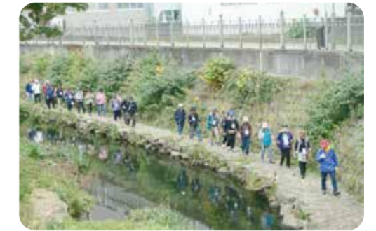
気持ち良く歩けるコースです