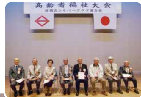
会長の皆さん、いつもありがとうございます

会員の皆さんが踊りやコーラス、カラオケなど、日頃の練習の成果を発表し、親睦を深めます。あわせて、長きにわたりシルバークラブの発展に貢献してきた、単位シルバークラブの会長に感謝状を贈呈する式典も開催します。現在は、工事中の港南公会堂の代わりに、磯子公会堂が会場です。