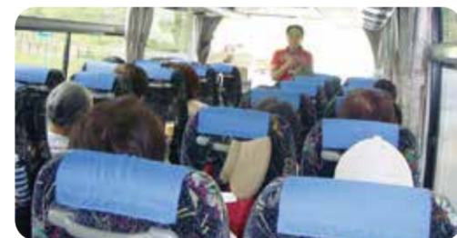
親睦日帰りバス旅行もあります