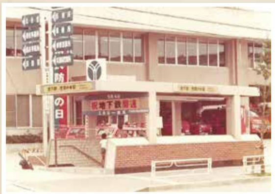
昭和51年9月、開業当時の港南中央駅