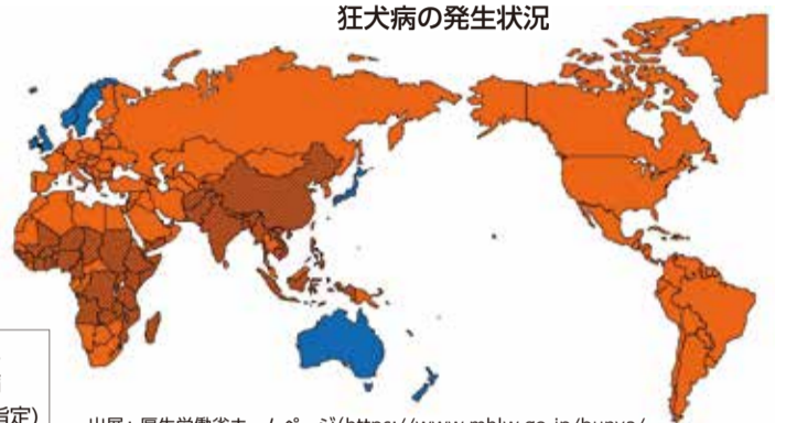
狂犬病の発生状況

現在日本での発生はありませんが、世界では150か国以上で年間5万人以上が亡くなっている恐ろしい感染症です。いったん発症すると治療はなく、人も動物も100%死亡します。