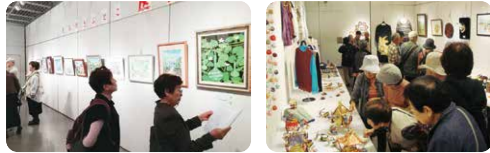
思わず見入ってしまう力作の数々

会員の皆さんが多彩な趣味と技能を生かし、日頃からこつこつと作り上げた作品(絵画、書道、写真、手芸)を区民文化センター ひまわりの郷で展示します。