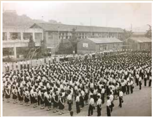
昭和46年に生徒数2,184人、51クラスと最大規模になった港南中学校。この翌年に笹下中学校が開校します

港南区が誕生したのは小学4年生の時。周辺にはまだ田んぼや畑があって、友達とホタルやオタマジャクシ、亀や青大将まで捕まえて遊ぶのが日課でした。自宅のすぐ近くに京急上大岡自動車学校ができるまで水銀灯に集まった山ほどのカブトムシを分けてもらい、虫かごに入り切らず、鳥かごで飼っていました。