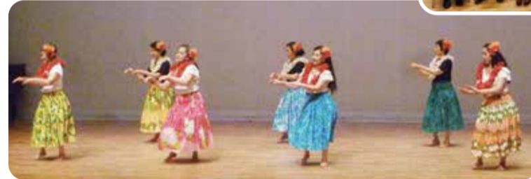
ステージ発表は活動のアクセントに

カラオケや囲碁・将棋の大会、1泊2日や日帰りの旅行など、ほかにもお楽しみがたくさんあります(昨年の1泊2日旅行は 恵那峡遊覧船クルージングと天竜下條温泉へ)!