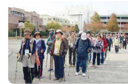
港南ふれあい公園をスタート

他の団体や区役所と一緒に開催している港南ふれあいウォーキングにノルディックで参加。約3kmのコースを歩きます。シルバークラブ連合会の皆さんは、昨年是最戸橋から青木橋の間の水辺の道などを歩きました。