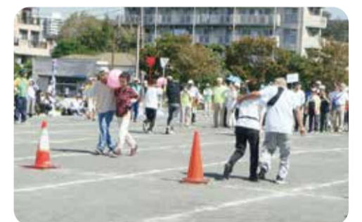
チームワークがものをいいます

会員と地域の皆さんと一緒に地区対抗(下永谷、野庭団地、日下・日野第一、日野・日野南、港南台、上大岡・大久保最戸、笹下、永野・日限山、野庭住宅、永谷・芹が谷の10チーム)で競技を行います。種目は、チームですぐ取り組めるゲートボール送りゲーム、なかよしリレーゲーム、玉入れなど。昨年は野庭団地チームが見事優勝! 今年は何のチームが優勝でしょうか?