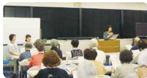
新たな知識を身に付けられる有意義なひとときです

健康、福祉、医療など、日常に役立つさまざまなことを学べる講座を開講しています。会場は市消費生活総合センター。受講生の募集は4月からです。(詳細は4月号でお知らせします)