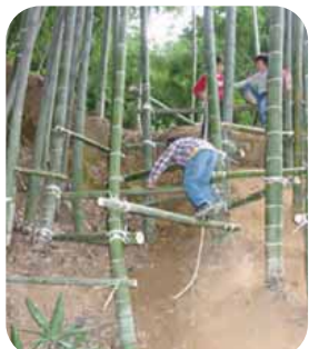
港南台生き生きプレイパーク