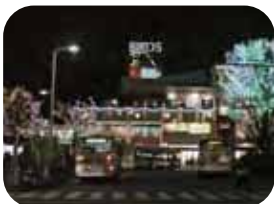
光の街イルミネーション