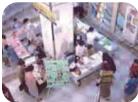
港南福祉ホーム活動展