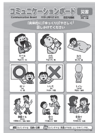
災害用コミュニケーションボード

御希望の方は、下記の事務局までお問い合わせいただくか、ホームページからダウンロードもできます。また、ホームページからは、必要なイラストを選んでボードやカードを作ることもできますので、御活用ください。