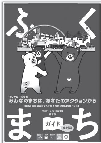
「ふくまちガイド実践編」