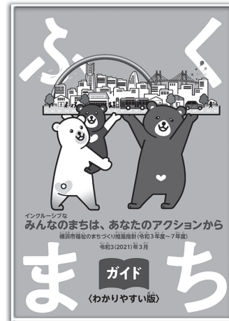
「ふくまちガイド わかりやすい版」