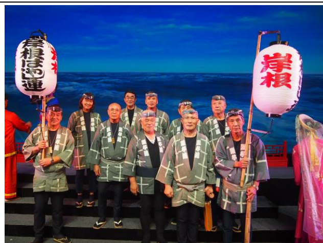
岸根囃子連の皆様