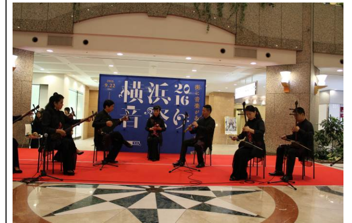
「横浜音祭り2016」出演 (泉州市南音楽団)