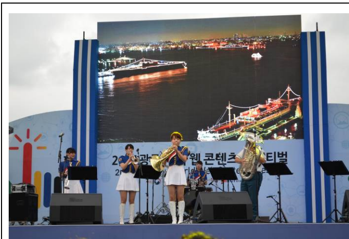
横浜市消防音楽隊演奏の様子