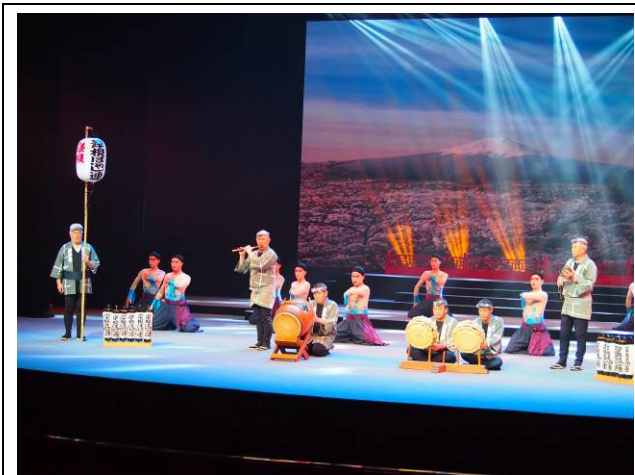
海上シルクロードフェスティバル 国際演劇展開幕式典での出演