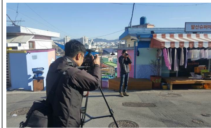
現地リサーチと撮影