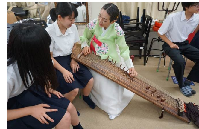
中韓伝統楽器体験（市立桜丘高校）