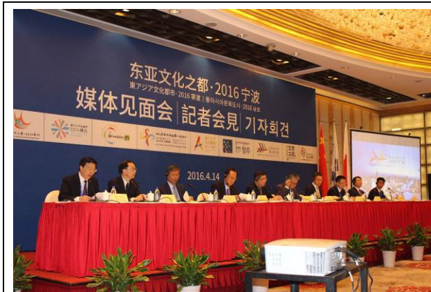
寧波市オープニング 9都市共同記者会見