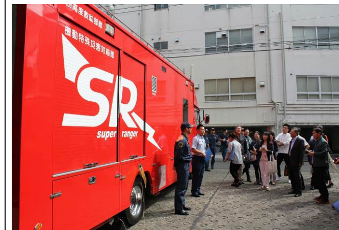
横浜市民防災センター見学