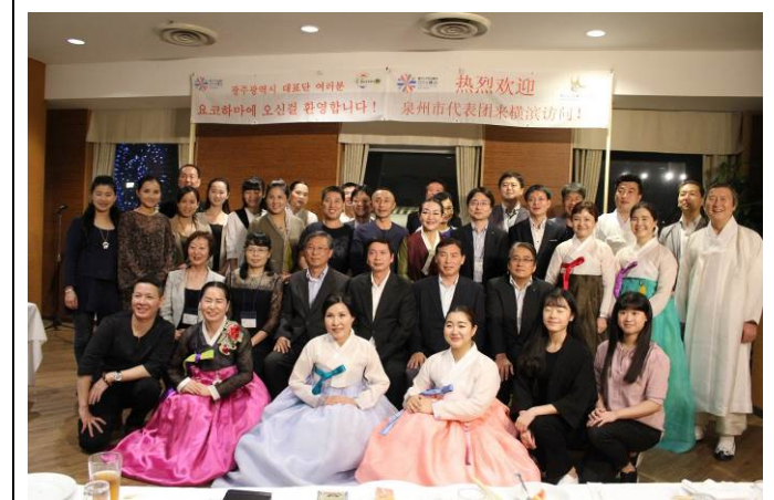
レセプションの様子