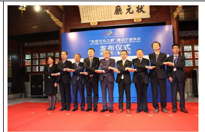
寧波市オープニング 9都市代表記念撮影