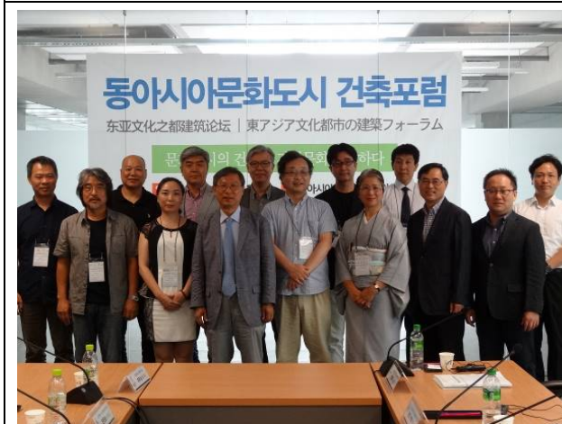
東アジア文化都市 建築フォーラム