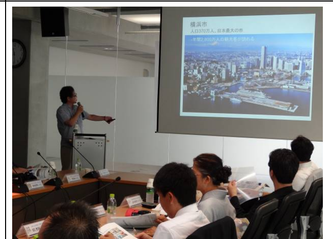
建築フォーラムでの横浜市プレゼンテーション