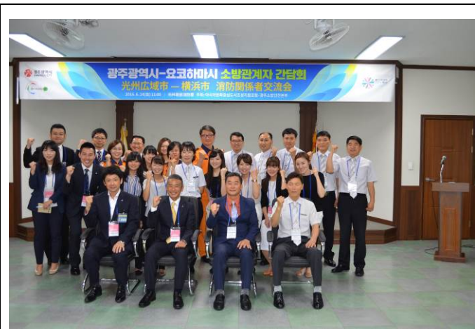
光州広域市東部消防署との交流会の様子