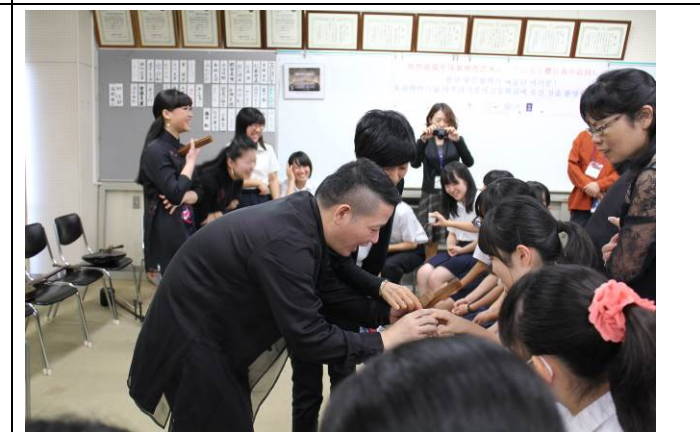
中韓伝統楽器体験（市立桜丘高校）