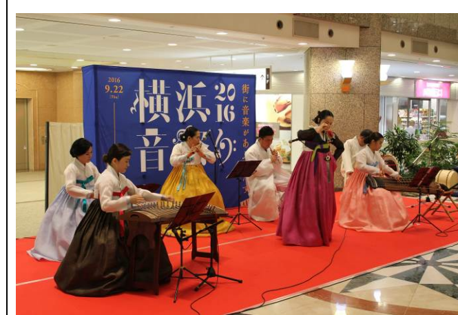
「横浜音祭り2016」出演 (光州広域市風流会「竹禪房」)