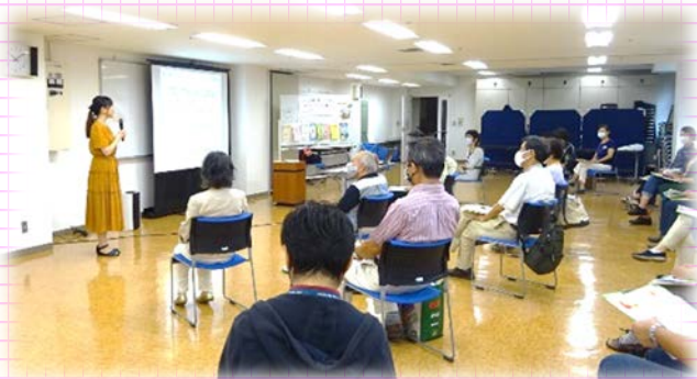
熱心に講師の話を聞く受講者たち

9月14日に助っ人BANK登録者向け交流会として上記講座を開催しました。新型コロナウイルス感染症予防対策を取りながら、19名の方が受講されました。アナウンサー経験のある講師から人前での話し方や人をひきつける話術のコツを学びました。助っ人BANK登録者は、人前で話す機会が多いため、活動に役立つと好評でした。