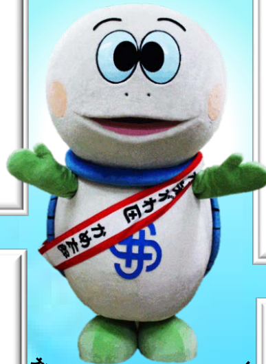
神奈川県マスコットキャラクター 「かめ太郎」