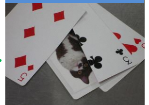
「3」のカードに猫のカードが挟まっていたんですね