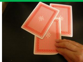
② 裏返して真ん中のカードを引きます