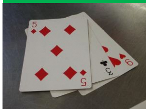
① 3枚のカードを見せます