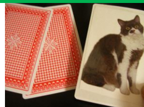
③ 真ん中は「3」の筈が猫のカードに