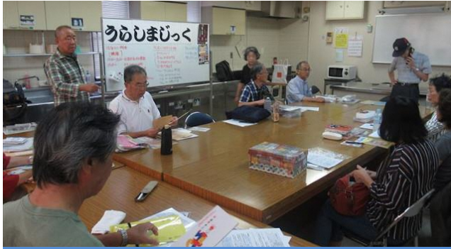
毎月第2・第4火曜日の練習風景

神奈川区の「老人福祉センター横浜市うらしま荘」を拠点に活動している手品のボランティアグループ「うらしマジック」を訪問しました。