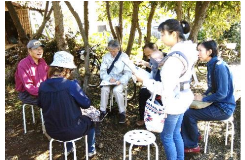
青空の下で取材は気持ち良かった～

1～3面の囲み記事は講座内の取材体験として、受講者が5つのグループに分かれて区民活動支援センター登録団体を紹介した記事です。