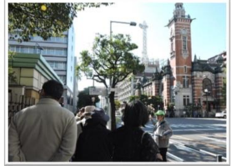
横浜市開港記念会館前で説明するガイド