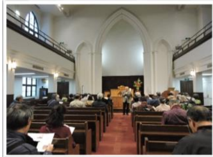
横浜指路教会スタッフの解説を聞く参加者

ガイドをする人たちは参加者や当日の現地の実情にあわせて企画の内容を調整したり、常に新しい企画を立ち上げたりしているとのこと。おもてなしの心を忘れずに努力していることが、リピーターの多さにつながっているようです。