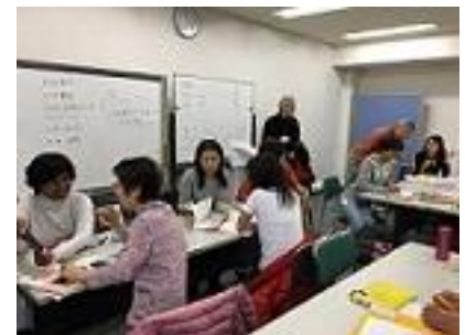
会場の交流室でにぎやかに

日本語教室には、台湾から来日し、日本語検定1級合格を目指す若者や、在日25年のソロモン出身の方など12の国と地域から約30名が参加。日本語教師のボランティアは22名が活躍しています。