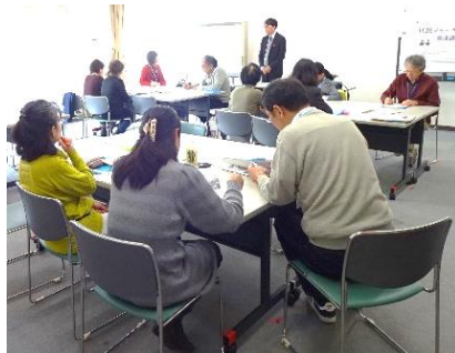
講師はタウンニュースの記者！

神奈川区の情報を地域目線で伝えていただく区民の編集ボランティア仲間を増やすため、平成30年10月25日～12月6日「区民ジャーナリスト養成講座」を開催しました。