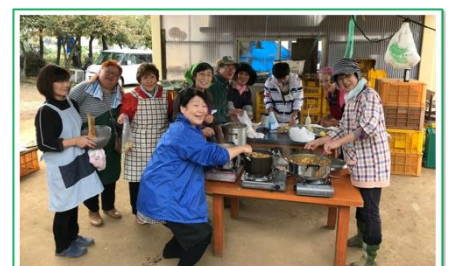
講座最終日は恒例のカレーパーティ

また、農家の仕事の手伝いや農作物の販売も行うほか、7月～11月までの5カ月間で6回行う「野菜づくり講座」が大好評とのこと。会員からは「家庭菜園に比べみんなで作業が分担できる」「休憩時間に情報交換ができてとても勉強になる」などの声が聞かれました。年会費は2000円でどなたでも入会可能。問合せは山田さん（電話090-7705-0636）まで。