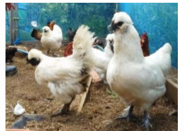
うこっけい 烏骨鶏