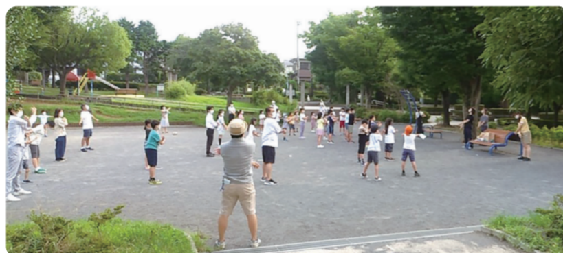
須郷台公園(緑園6丁目)