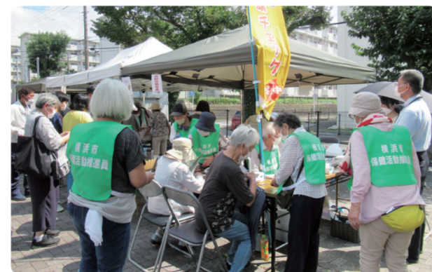
ふれあい暖地マルシェの様子

今後も地域全体で協力しながら、住民同士がつながり、気軽に交流できるような楽しいイベントを実施していきたいと思ひます。