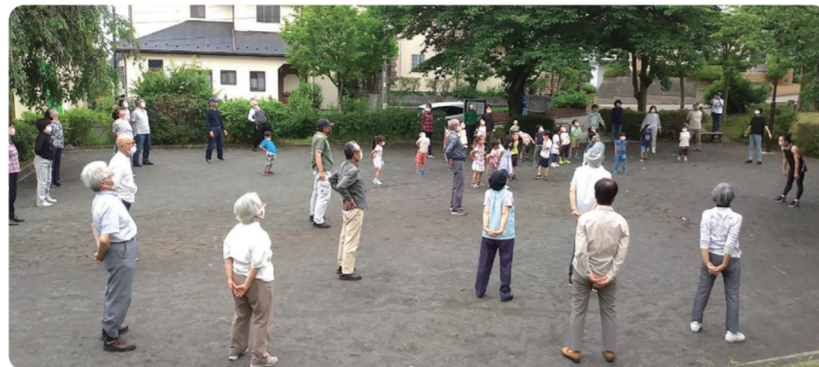
北ノ入公園(緑園5丁目)

「ラジオ体操とふれあい交流の場」として、地区内の7つの自治会が近場の公園等を拠点に取り組み、子供会や近場の保育園と連携し、児童や園児も参加しながら、それぞれの自治会が独自の方法で楽しく進めています。