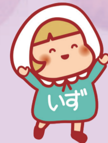
泉わくわくプラン 推進キャラクター 「いずちゃん」

泉区では、毎年2月を「泉わくわくプラン」推進月間として、より多くの人に泉わくわくプランを知っていただく機会を増やしています。今年も地域で行われている泉わくわくプランの取組をご紹介します。皆さんも一緒に参加してみませんか?