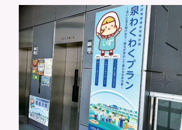
推進月間の取組 (区役所エレベーター横などにパネル設置)