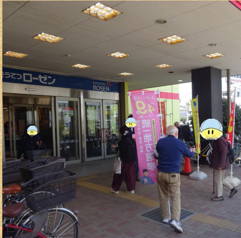
相鉄ローゼンやBeans新杉田での街頭啓発（ティッシュ配り）