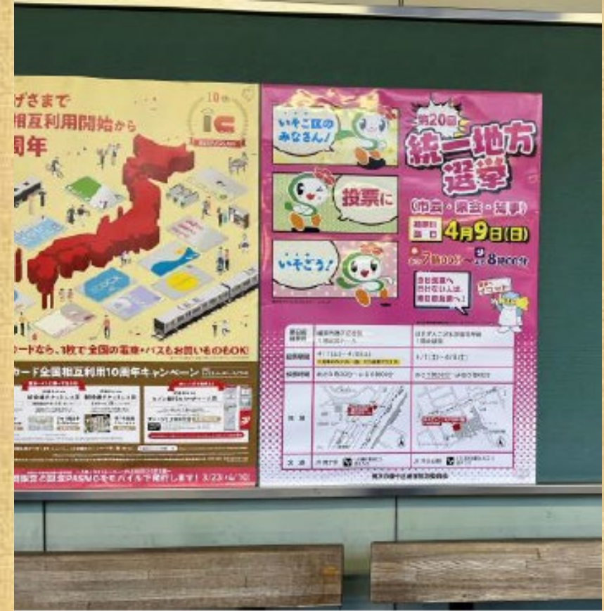
ポスターを区内の駅等に掲出（写真は京急本線屏風浦駅）