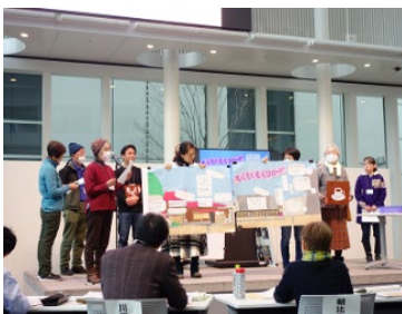
熱意溢れるプレゼンテーション

【評価ポイント】整備予定場所が、地域にとって、守っていききたい大切な場であることが認識できた。また、整備により、テラスやステージが、どの世代にも、夢が叶う場、助け合える場として活用され、まちづくりが発展していくことが期待できた。