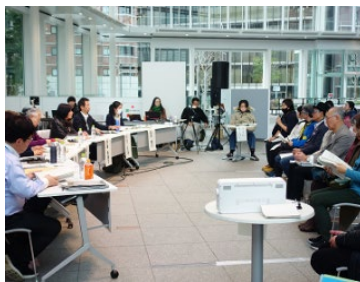
審査員との質疑応答