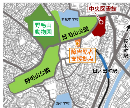
〈野毛山地区 案内図〉