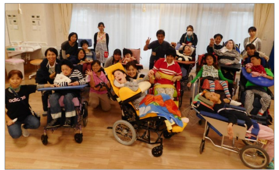
〈横浜市多機能型拠点「こまち」(瀬谷区)の様子〉

旧青少年交流センター跡地(西区老松町 25-3)を活用し 医療的ケアを必要とする重症心身障害児者等 を対象に生活介護、短期入所、相談支援、診療所等のサービスを一体的に提供する支援拠点『横浜市多機能型拠点』を新たに整備します。(市内5か所目・令和10年度開所目標)