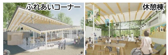
(仮称)ズーペリエンタ!センター

ふれあいコーナー・休憩棟などの充実(令和6年度先行整備)や、動物の観察・遊び・休息が一体となった中心施設「(仮称)ZOOPERIENTA! CENTER(ズーペリエンタ! センター)」の整備(令和10年度完成目標)等により、さらなる魅力向上やバリアフリー化を進めます。