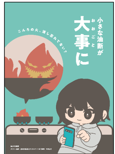
図5 春の火災予防運動用ポスター (デザイン制作：木村心咲さん)

同校学生が考案したデザインを火災予防運動啓発用ポスターに採用（図5参照）します。また、令和5年秋の火災予防運動の際に同校学生が制作したデジタルサイネージ用動画も引き続き活用します。