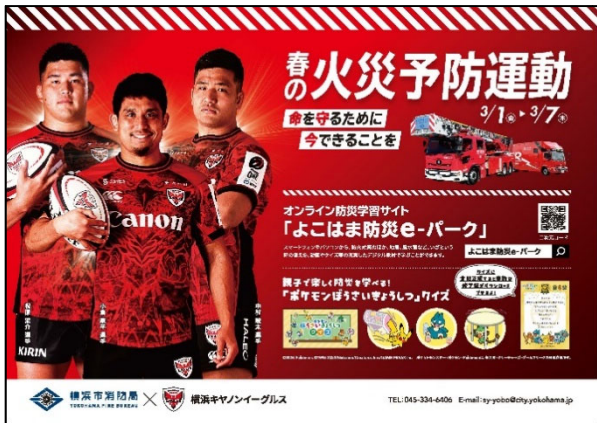
図3 春の火災予防運動用ポスター (横浜ゆかりの3選手を起用)