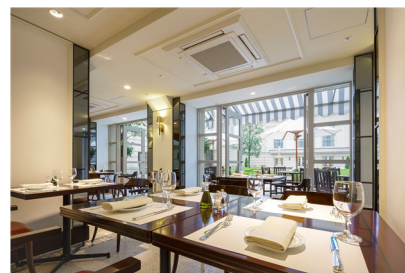
ホテルニューグランド 「イル・ジャルディーノ」ペアランチ券 (1組 2名様)