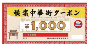
横濱中華街クーポン 1,000円 (10名様)