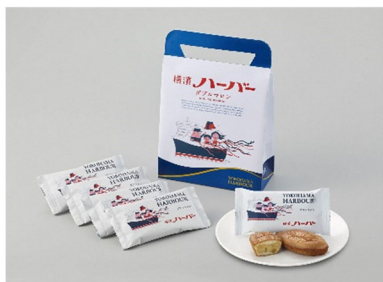
横濱ハーバーダブルマロン5個入り (10名様)

※複数回応募した場合、全プレゼントを通して当選者が重複しないように抽選を実施します。