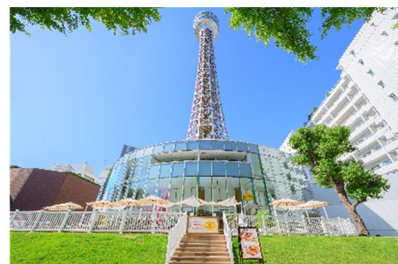
横浜マリンタワー 展望フロアチケット (10組 20名様)