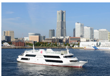
マリンルージュ招待乗船券 (1組 2名様)