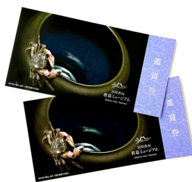
宮川香山真葛ミュージアムチケット (10組 20名様)