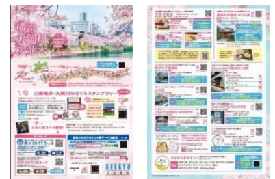
▲キャンペーンチラシ