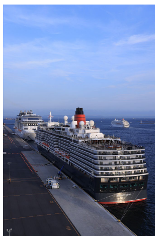
佳作 <大型船に見送られ>