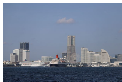
佳作 <客船の似合う街>