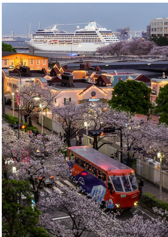
特選 <新たな始まり:春桜と船の出会い>