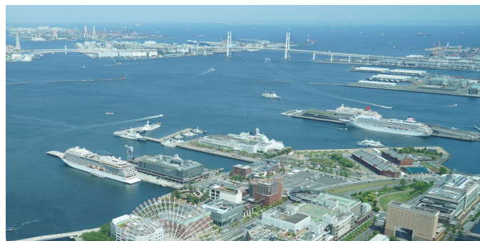
横浜市港湾局長賞 <5隻のクルーズ船>