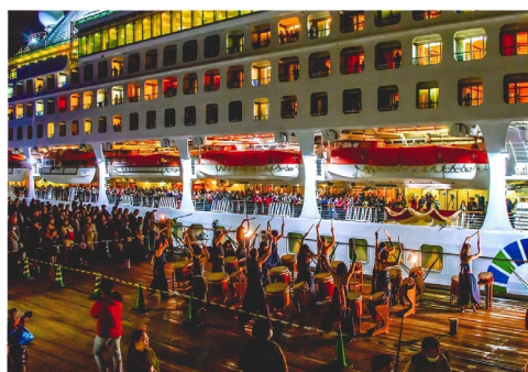
横浜港振興協会会長賞 <いい日旅立ち>