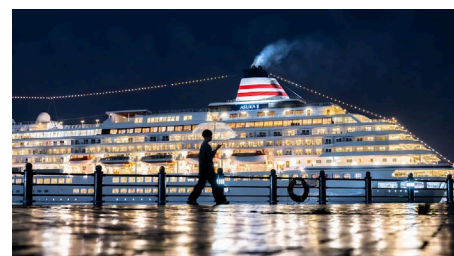
佳作 <雨の日の飛鳥Ⅱ>