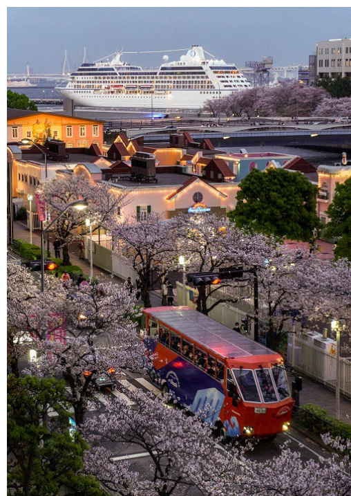
特選 <新たな始まり:春桜と船の出会い>