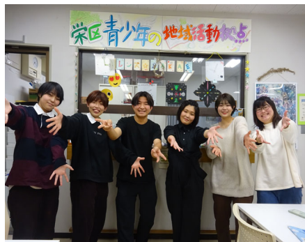
【青少年の地域活動拠点の活動】