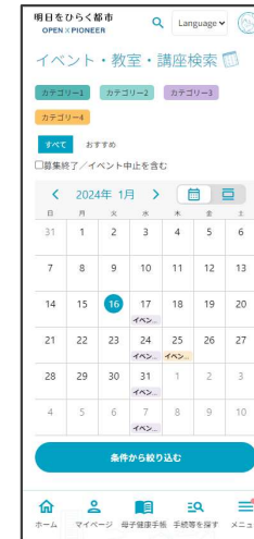
イベントカレンダー マイカレンダー