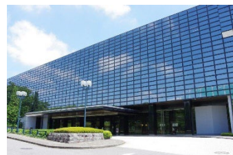
緑山スタジオ スタジオ棟

なお、横浜市は 2018(平成 30)年に地域経済活性化等に資することを目的として株式会社 TBS ホールディングスと包括連携協定を締結しました。