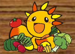
旭区マスコットキャラクター あさひくん

昨年度に引き続き、地元の野菜を区役所でお買い求めいただける「あさひの朝市」を開催します！