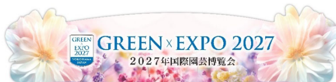
「GREEN×EXPO 2027」特設フォトスポット