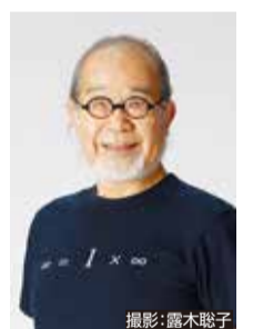
講師 鎌田 実 (医師・作家)

【問合せ】横浜市老人クラブ連合会 ☎433-1256(月～金曜(祝休日、年末年始除く))9時～17時 📠433-1257