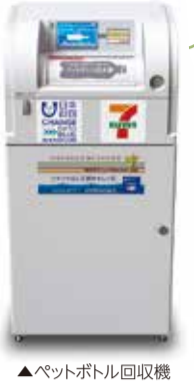
▲ペットボトル回収機