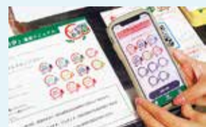
モバイルスタンプラリー(2020年12月開催)▶

港北区では、国の「GoTo商店街事業」を活用し、感染症対策に配慮しつつ身近なお店で買い物を楽しめる非接触のモバイルスタンプラリーを2020年12月に開催し、区内の11商店街が参加しました。