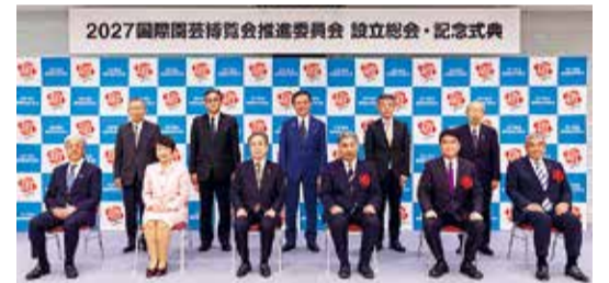
▲2027国際園芸博覧会推進委員会 設立総会記念式典

博覧会をPRするための「推進ロゴマーク」は、横浜で開催する国際園芸博覧会に、花・緑・農をはじめとした世界の自然、人、文化が集まる様を、花をモチーフに表現しています。詳しくは、ウェブサイトをご覧ください。