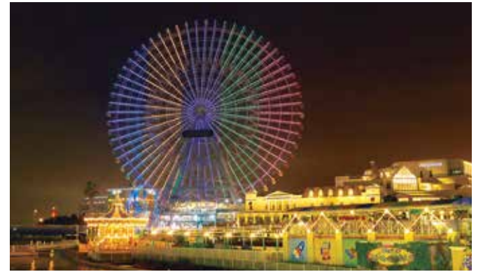
▲2019年夏に開会1年前を記念して実施した様子

ツイッター・インスタグラムで東京2020大会に関連する情報発信中。フォローをお願いします。