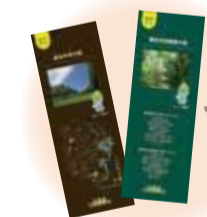
▲森歩きのお供に「市民の森ガイドマップ」