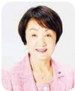
横浜市長 林 文子

最大の特徴は、オールジャンルの音楽を楽しむこと。クラシック、ジャズ、ポップス、日本の伝統音楽など幅広い音楽に触れられるのは、「横浜音祭り」ならではです。世界で活躍するトップアーティストの新たなチャレンジや、異なる音楽ジャンルのコラボレーション、アートや映像など音楽以外の分野との組み合わせなど、ここでしか体験できないオリジナルの内容も見逃せません。