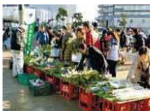
▲みなとみらい農家朝市(西区)