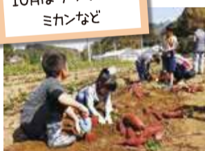
▲舞岡ふるさと村(戸塚区)