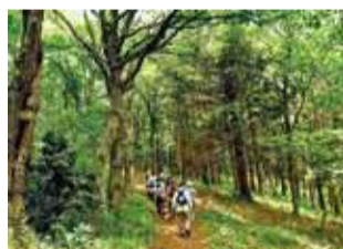
▲新治市民の森(緑区)