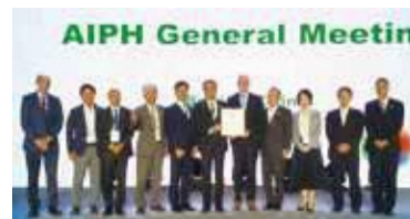
▲国際園芸家協会の年次総会での承認の様子

本市では、2015年6月に米軍から返還された旧上瀬谷通信施設での、都市基盤の整備を進め、地域の知名度やイメージの向上、さらには国内外の先導的なまちづくりに寄与するため、国際園芸博覧会の招致を推進しています。