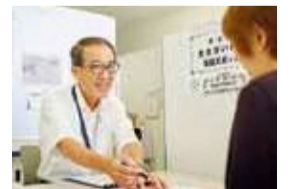
▲専任のキャリアカウンセラーが面談します。