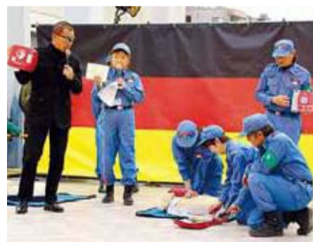
▲防災・救急救命の啓発活動にも積極的に取り組む

今後は少しでも多くの人に防災意識をもってもらえるように、社会貢献活動にも力を入れていきたい。