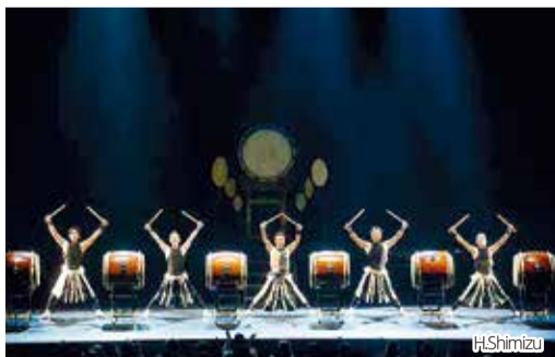
▲「日本博」(2018年10月/パリ)での演奏の様子

ンゼルスの高野山北米別院の住職になった(ちなみにその前の住職は喜多川諦道師、ジャーニー喜多川氏の父君)。私の長兄(僧侶)は戦後、高野山南米別院を建立するためにブラジルに渡った。2人とも帰るはずだったが彼の地で人生を終えた。横浜からの船出だった。