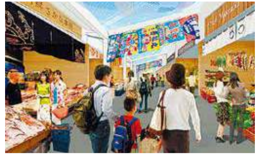
▲ランチ横浜南部市場イメージ

中央卸売市場本場を補完する役割を担う横浜南部市場に9月20日(金)、複合商業施設「ランチ横浜南部市場」が新たに開業します。また、市場のプロも利用する食品関連卸売センターが、市民の皆さんが買い物できる商業施設になります。開業から4日間は、ステージやマルシェなどのイベントを開催しますので、ぜひ来場してください。