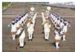
▲横浜市消防音楽隊

※9月23日(月・祝)ららぽーと横浜、9月29日(日)横浜駅東口はまテラスについては、消防音楽隊は出演せず、中学校単独の演奏会となります。それ以外は消防音楽隊と共演を行います。