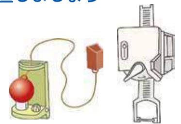
▲分電盤に取り付ける簡易タイプの感震ブレーカー

大きな揺れを感じた場合に電気を自動で止める「感震ブレーカー」の設置は、地震時の出火の危険性を大きく減らす効果が期待できます。